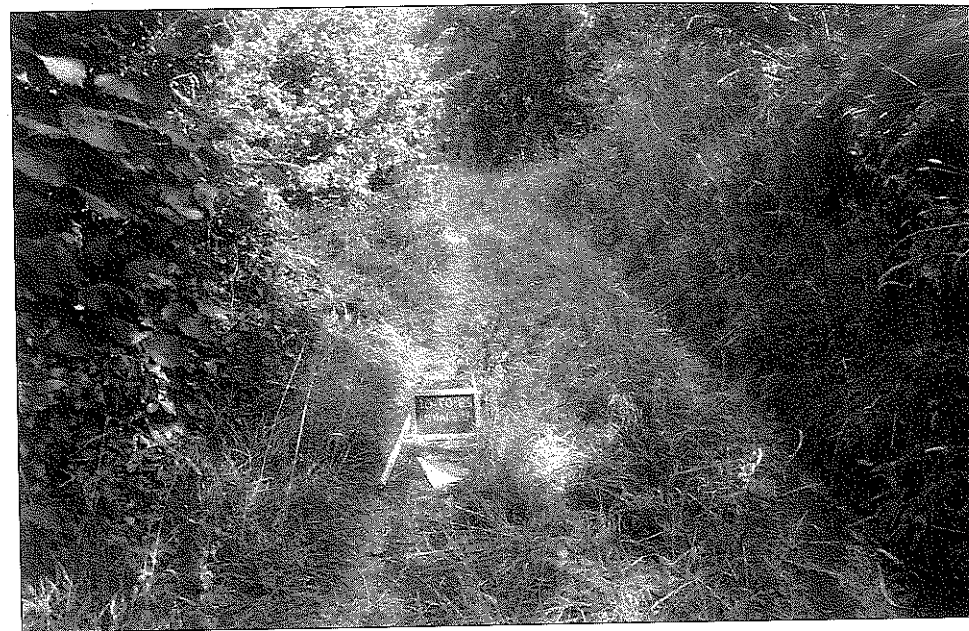
2 - LOC. CASE GIANO. Un percorso di mezzacosta dall'area di Geminiano a Cremeno.