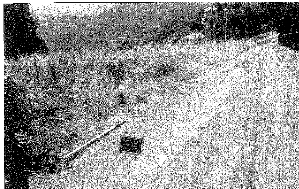
4 - PASSO DELLA VITTORIA. Loc. Canarino. Un percorso di raccordo fra la Valle Scrivia e la Valpocevera.