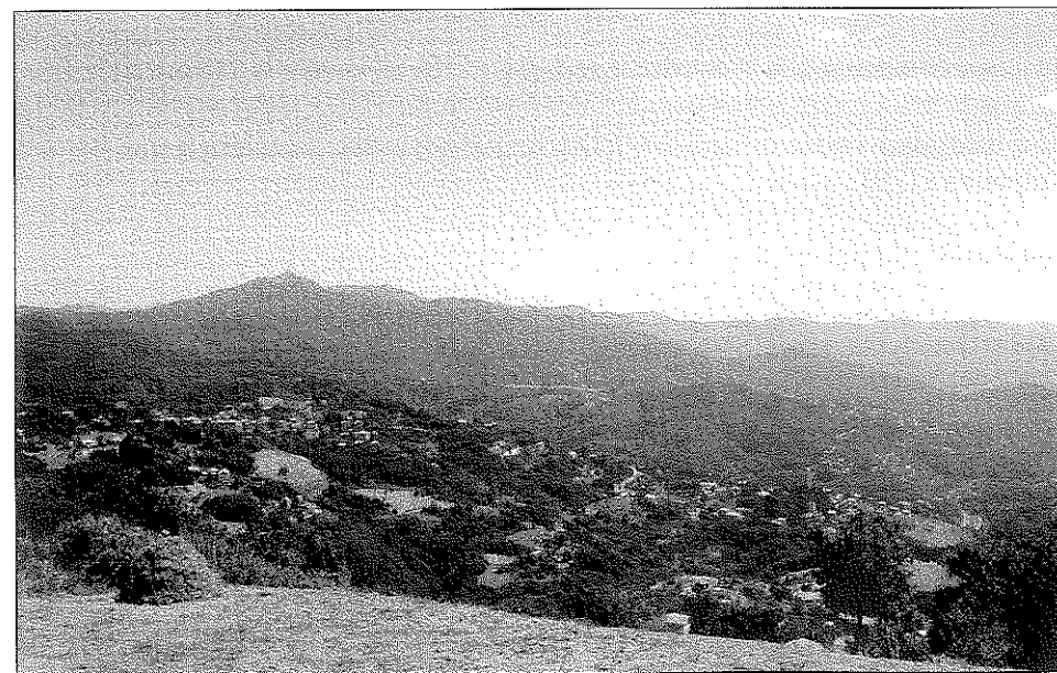
5 - Vista della Valpocevera dal Passo della Vittoria.