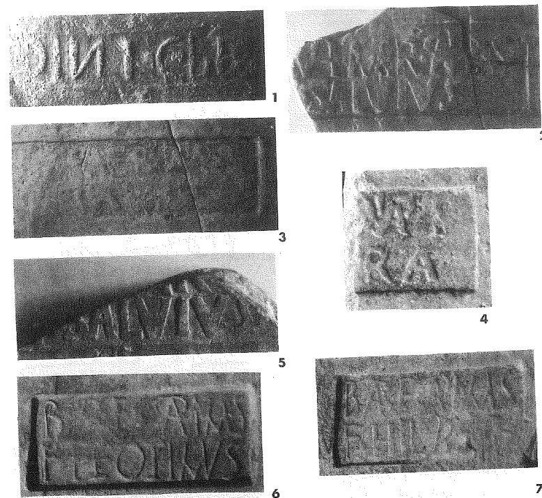
Tav. I – I bolli rinvenuti