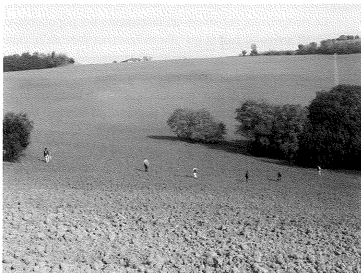
Fig. 4. Ricognizioni in corso nell' ager Firmanus.