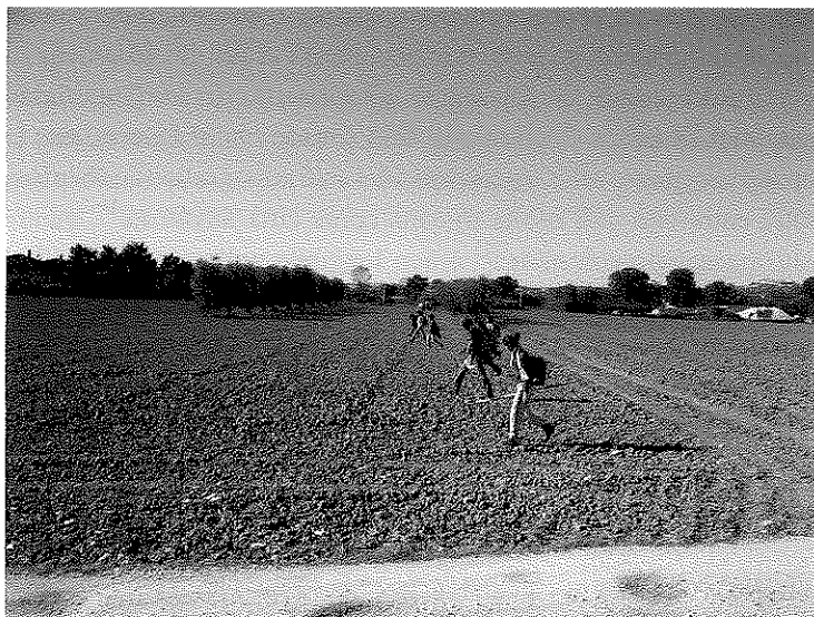
Fig. 3. Ricognizioni in corso nell' ager Pisanus.

Questa accurata analisi dei rinvenimenti, appunto anche negli aspetti post-deposizionali, ci permette di testare l'effettivo potenziale informativo delle ricerche di superficie per la ricostruzione dei paesaggi an-