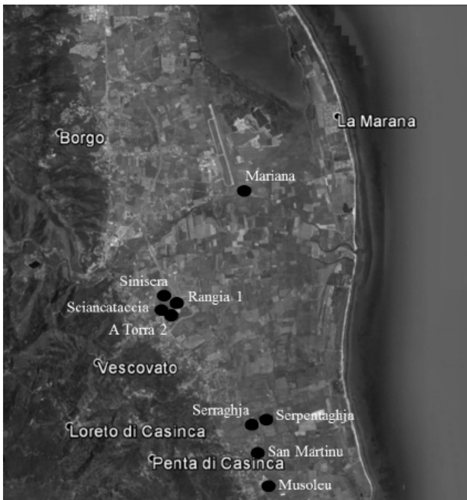
Fig. 2. Siti documentati nella zona di Mariana (elaborazioni grafiche di G. Picchi).

Casinca, loc. San Martinu (fattoria? di III–I sec. a.C.) 38 ; Penta di Casinca, loc. Musoleu (villa di I sec. a.C. – 1° metà IV sec. d.C. e abitato rurale di I–VI sec. d.C.) 39 , Acqua Bona (abitato rurale di età repubblicana) 40 .